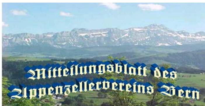
Bildnachweis: Alpstein mit Säntis im Sommer, Martin Egeli, Teufen / www.teufenAR.ch