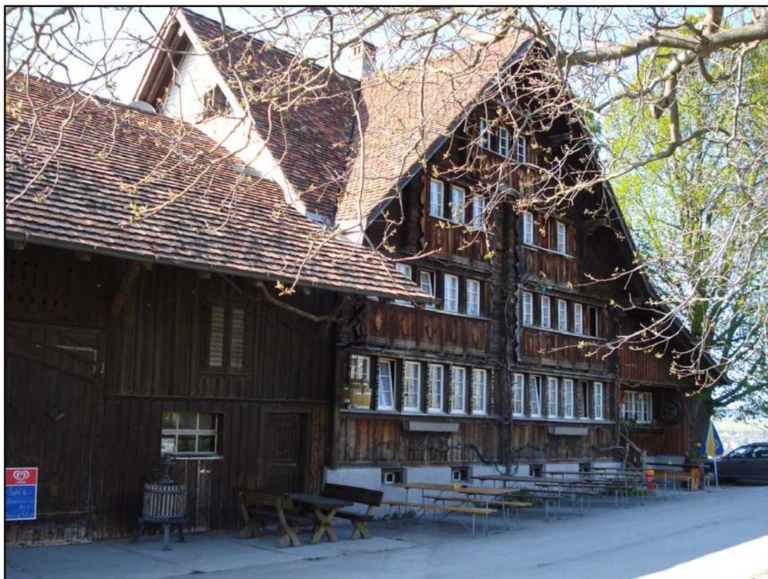
Restaurant zur Traube, Muelt