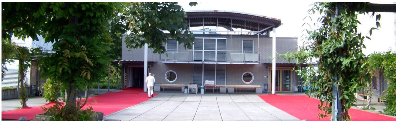
Aula des Oberstufenzentrums Goldach – (ohne Gewähr dass der rote Teppich ausgerollt sein wird!).